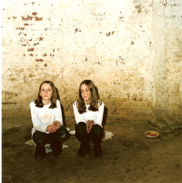
vidéos still de « Thin Line » Edition dvd 2006

Un des jeux de nourriture de LA Raeven entre les mains de jumelles au stade pré pubère. Dans un sous sol glauque ( tels des otages ), l'une, la gagnante, doit manger les 2 repas ( menu continental complet ) et la perdante est privée de tout. Le jeu est répété jusqu'à l'écoeurement face à l'autre qui exprime un réel sentiment de faim. La vidéo 'Thin line' montre un assaut sur l'individualité ainsi que la stratégie pour échapper à cet assaut.