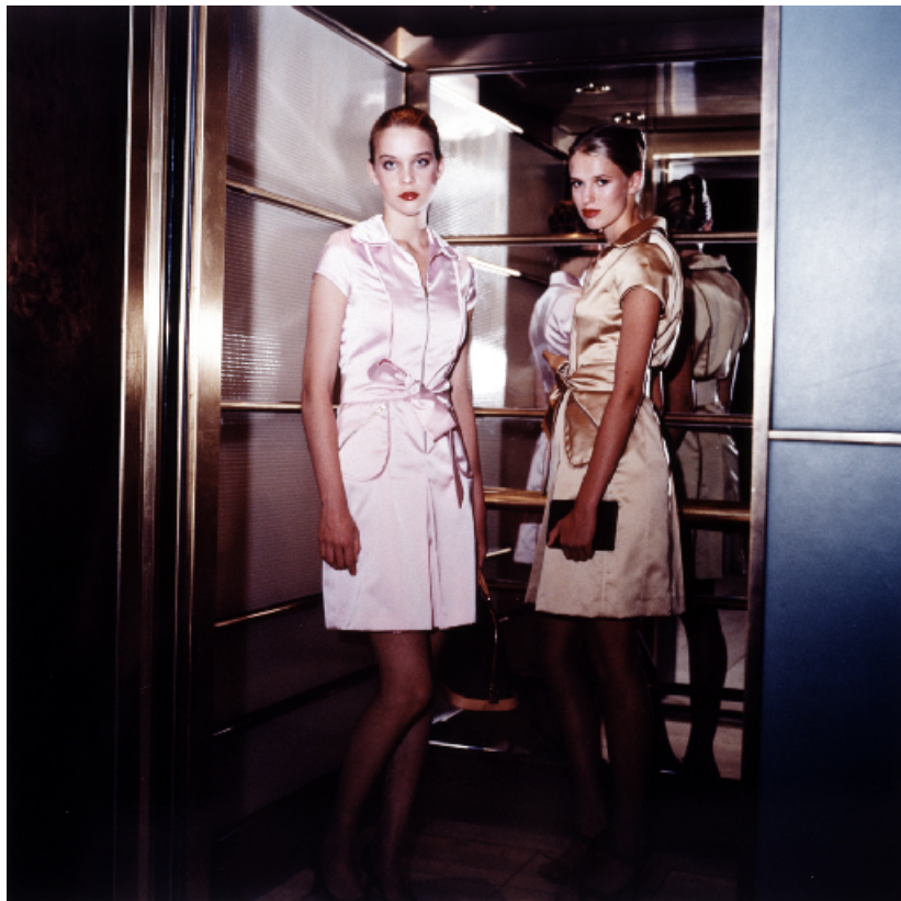
Vidéo still extrait de « Sibling Rivalry » dvd –2004 -